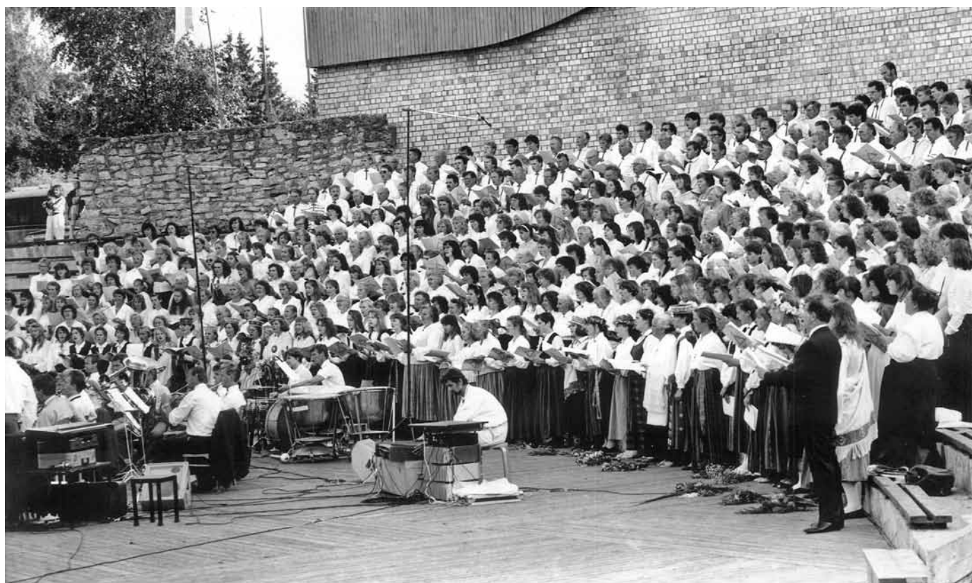
Dziesmu svētku kopkoris trešajos Dziesmu svētkos – Talsu Sauleskalna estrādē 1992. gadā.